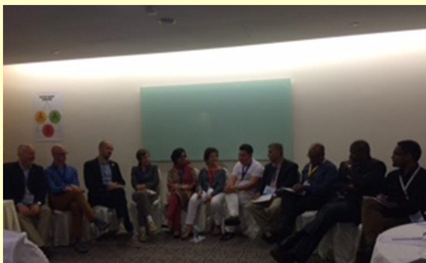
Workshop om politisk korrupsion

Særlig chapters i EU drøftede også, hvordan medlemmerne kan blive mere konkret involveret. Tyskland har haft stor succes med såkaldte arbejdsgrupper. Et initiativ som jeg vil forslå også blive forsøgt her i Grønland.