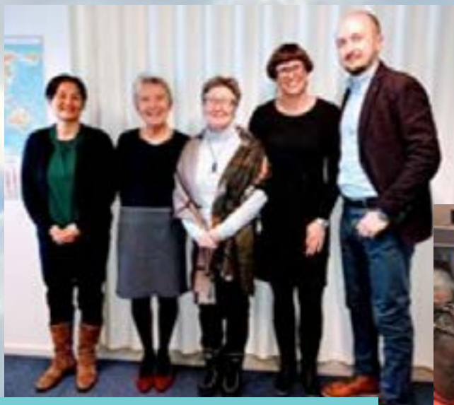
Møde med borgmester i Kommuneqarfik Sermersooq.

Årets resultat udviser et overskud på 4 t.kr. mod et overskud på 111 t.kr. i 2016 (heraf øremærket 175 t.kr. til projekt, der forventes afviklet i 2018). Foreningens økonomi hviler dels på medlemsbidrag og dels på donationer fra fonde. I 2017 har GrønlandsBANKEN's Erhvervsfond bl.a. givet 250 t.kr. til understøttelse af projekter og til drift af sekretariatet.