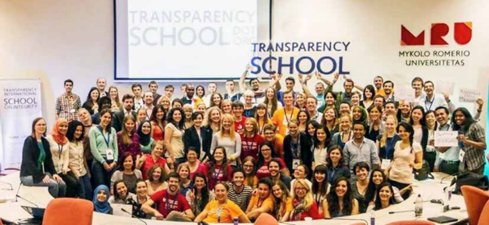
Deltagere i Summerschool 2014.

IPIS kr. 31.119,75 til grønlandisering af informationsfilm om FN's Handicapkonvention. TIG i samarbejde med Ilisimatusarfik Institut for læring kr. 39.000 til udvikling af værktøjer til folkeskolelærere for undervisning i antikorrupsion. TIG i samarbejde med Grønlandske Advokater kr. 32.250 til Håndbog om offentligt ansattes ytringsfrihed. TIG i samarbejde med Grønlands Arbejdsgiverforening kr. 37.500 til GAP analyse. Fra sidstnævnte donation er kr. 15.000 leveret tilbage, da oversættelse ikke blev nået i 2014.